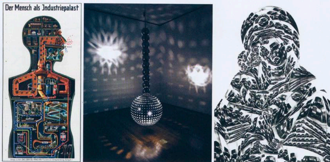
FRITZ KHAN. POUR « DAS LEBEN DES MENCHEN », 1926. Poster (98 x 51 cm). > OTTO PIENE, HÄNGENDE LICHTKUGEL, 2010. Technique mixte (227 x 70 cm). > THOMAS BAYRLE, MADONNA MERCEDES, 1989. Collage et photocopie, dispersion sur bois (198 x 146 cm). > HENRIK OLESEN, THE BODY IS A MACHINE, 2010. Page de droite : huile sur toile (100 x 80 cm).

une structure sphérique qui plonge le visiteur dans un pêle-mêle de projections de films, de diapositives et de dessins. Une anticipation plutôt agréable d'un monde englouti par le flux d'images, et qui rappelle certaines scènes beaucoup plus violentes du film Blade Runner . Des œuvres de visionnaires et de passionnés, qu'ils soient écrivains ou artistes, explorent ainsi les peurs et les aspirations générées par les technologies. Le sculpteur américain autodidacte Emery Blagdon réalise de 1956 à 1986 une série de constructions suspendues qui pourraient, pensait-il, guérir certaines maladies. Wilhelm Reich construit dans les années 1940 Organs Energy Accumulator , réactualisée ici, dans laquelle le visiteur assis est supposé débloquer le flux d'énergie vitale. La relation entre l'homme et la machine est naturellement une question qui anime les artistes. Gynécologue juif allemand et écrivain scientifique, Fritz Khan